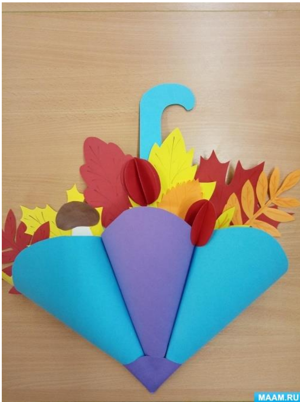
Украшаем наш зонт разноцветными кружками